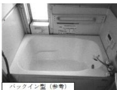
バックイン型（参考）