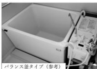
バランス釜タイプ（参考）

なお、一部の住宅では、室内に洗濯機の設置スペースが確保できない住戸タイプがありますので、ご注意ください。